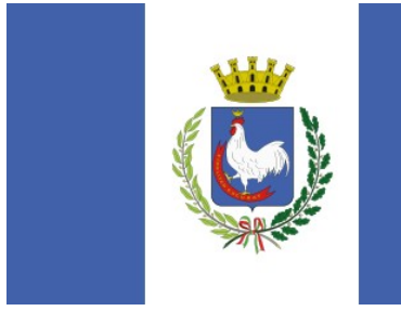
Comune di Gallipoli