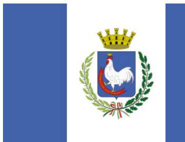
Comune di Gallipoli