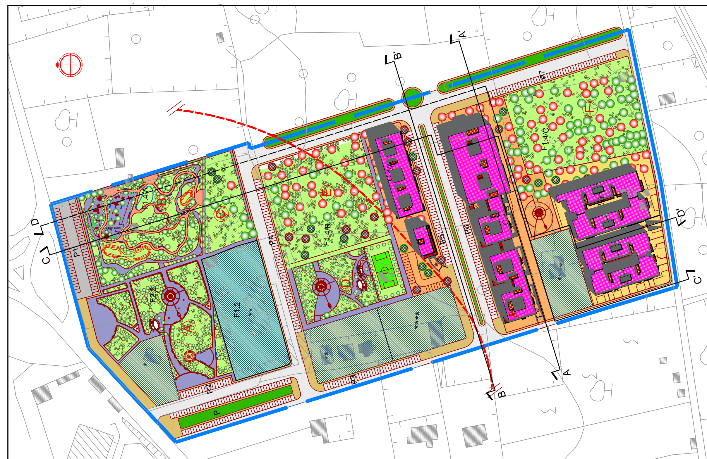
PLANIMETRIA GENERALE - scala 1: 2000