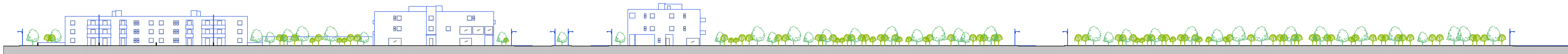
SEZIONE D - D' - scala 1: 500