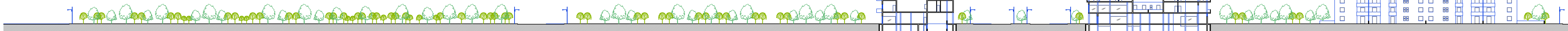
SEZIONE C - C' - scala 1: 500