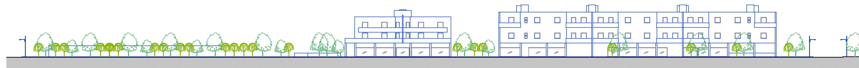
SEZIONE B - B' - scala 1: 500