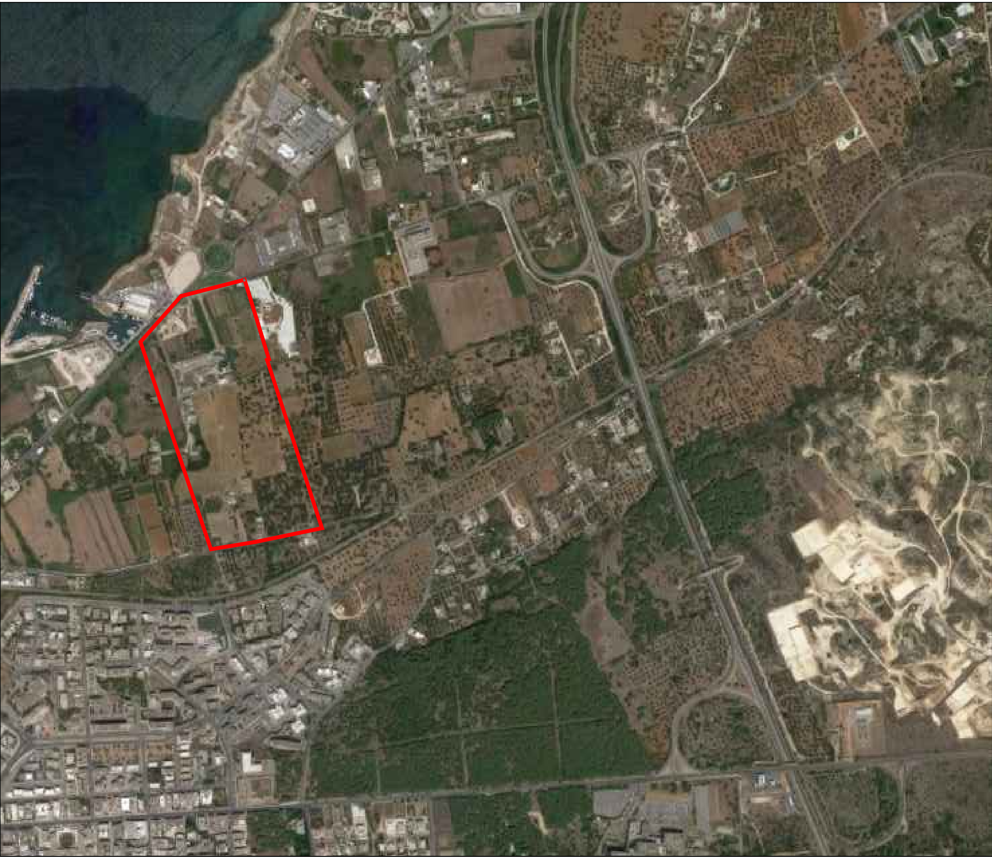
ORTOFOTO - INDIVIDUAZIONE COMPARTO R2b - SCALA 1 : 5000