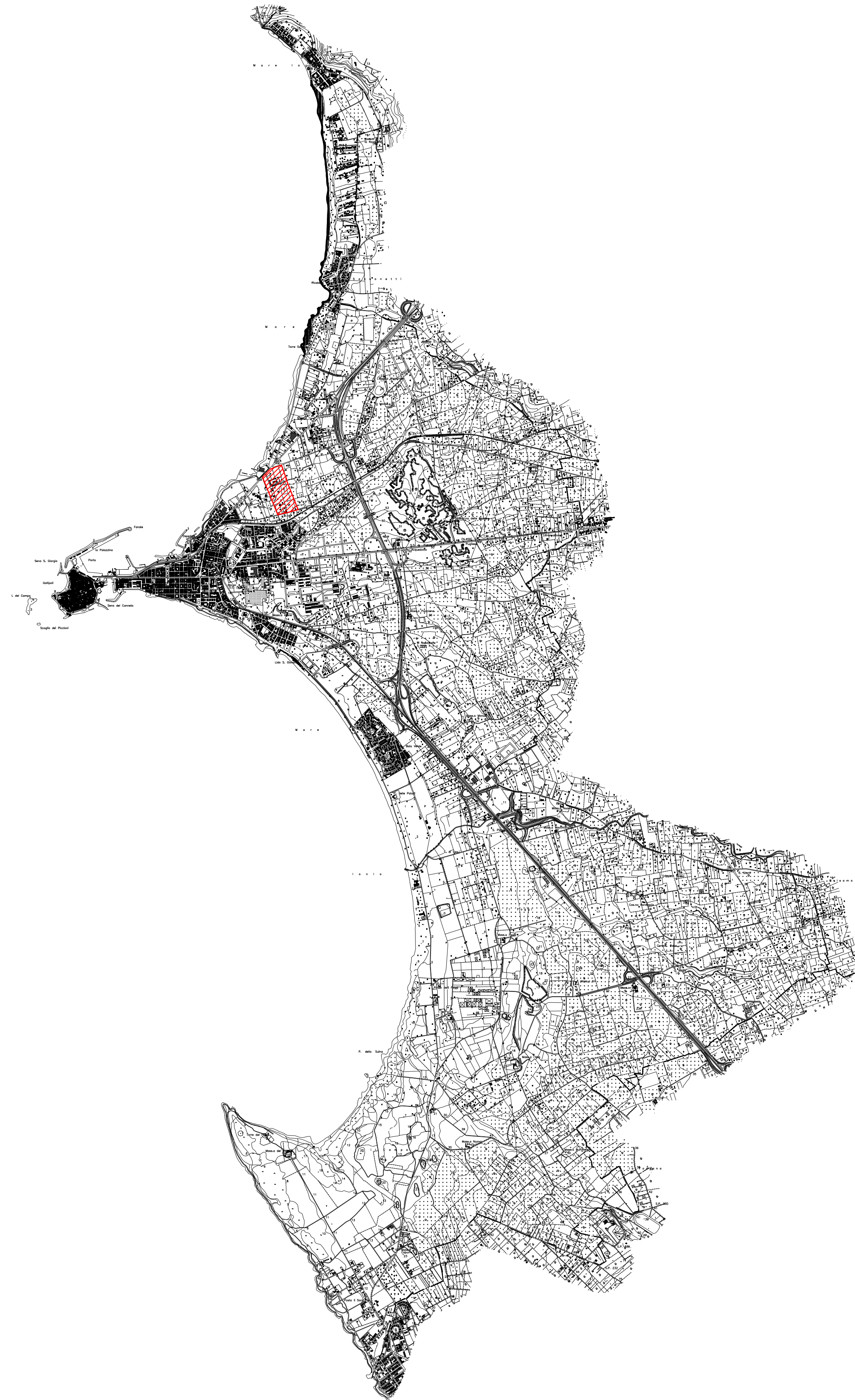
INDIVIDUAZIONE COMPARTO SUL TERRITORIO COMUNALE SCALA 1 : 25.000